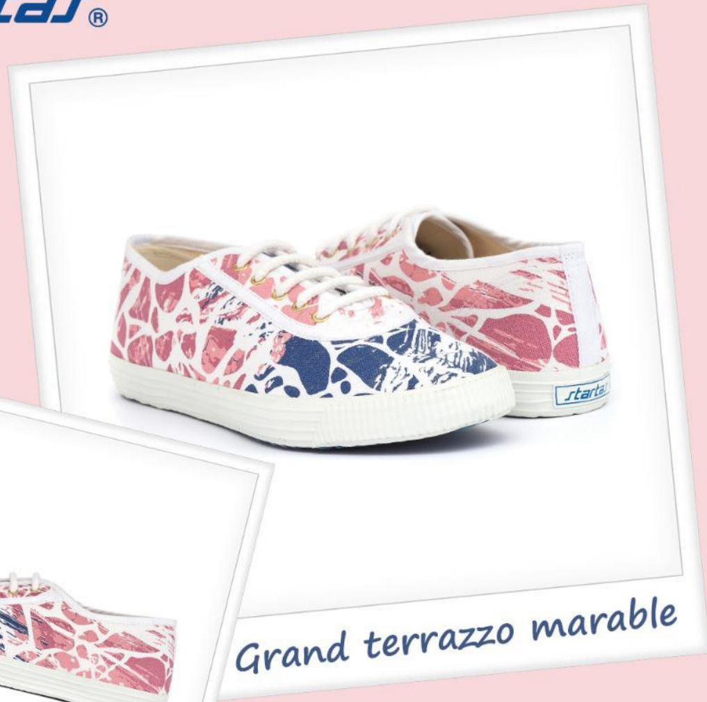
Grand terrazzo marable