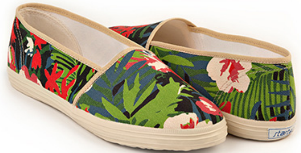
Jungle boogie / ident 19748