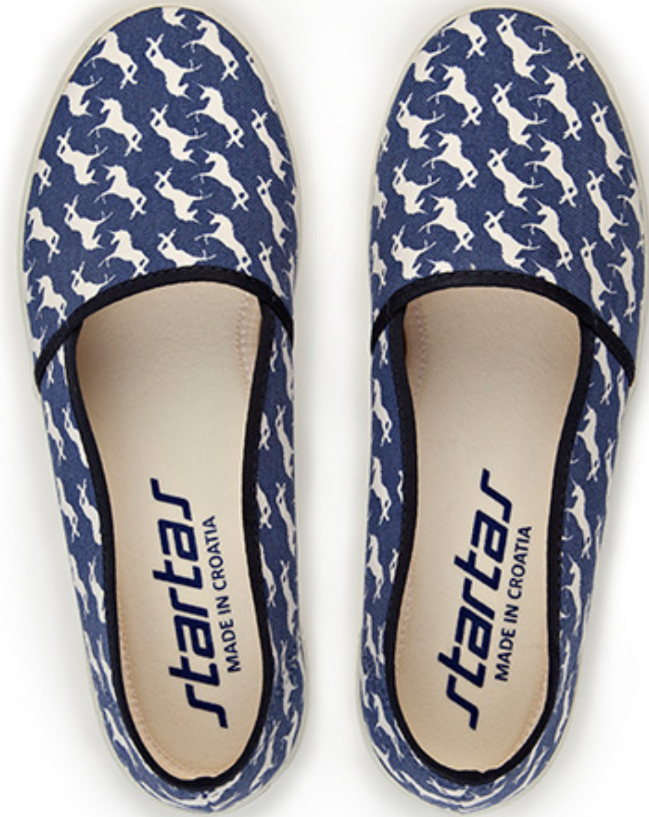
Blue Unicorn / ident 19431