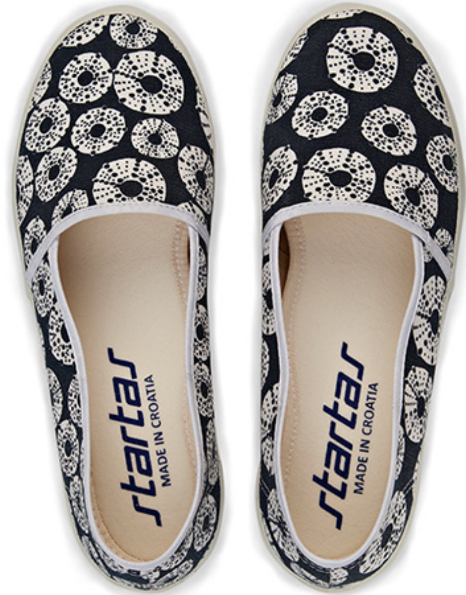
Ježinci / ident 19749