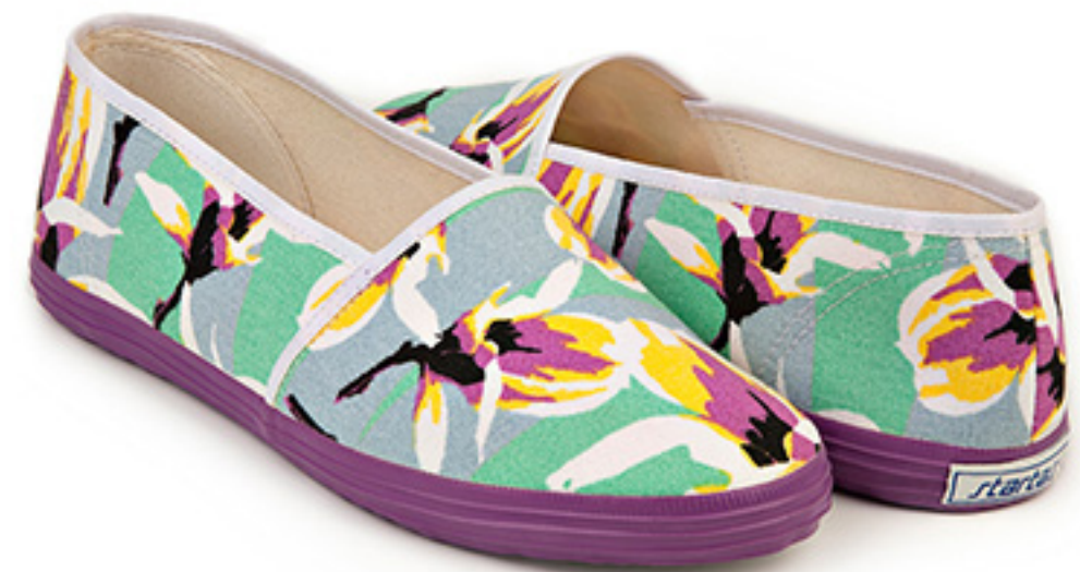
Magnolia / ident 19751