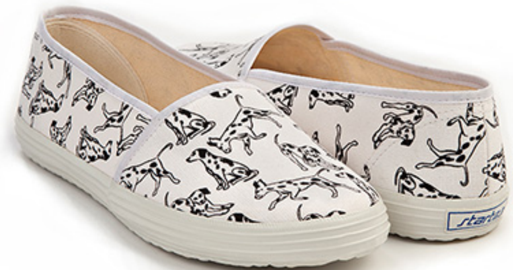
Dalmatiner / ident 19750